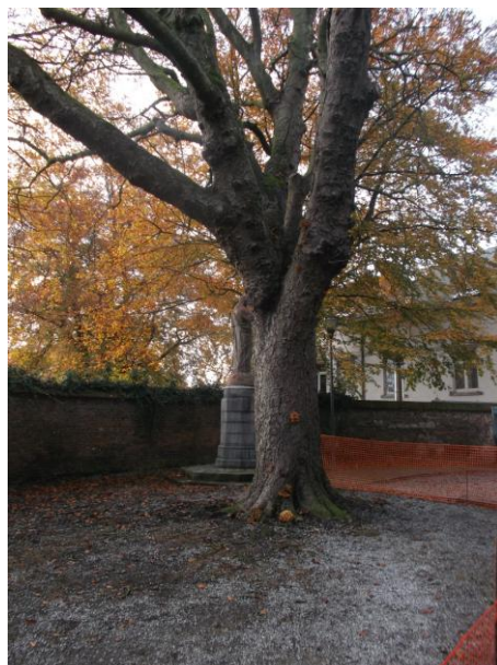
Figure 3 : Présence du champignon Flammulina velutipes

Ce marronnier a dû être abattu pour des raisons de sécurité. Il présentait une déficience de vigueur. De nombreuses branches charpentières et parties de tronc étaient mortes et dégradées par le champignon saprophyte Flammulina velutipes .