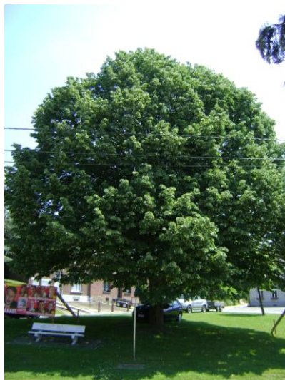
Figure 7 : Tilleul argenté

Au croisement de la rue de Thébais et de la rue du Cimetière, on peut observer un tilleul argenté ( Tilia tomentosa ).