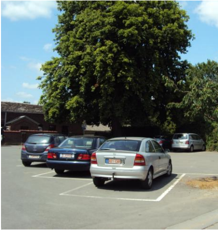
Figure 6 : Photo du Marronnier prise en été (après les travaux d'élagage)

Ces travaux ont été réalisés en 2011. Depuis, le spécialiste des arbres remarquables de la Région wallonne est déjà revenu inspecter l'arbre. Ce dernier a réagi positivement à son élagage de 2011. Toutefois, il sera surveillé régulièrement pour détecter toute dégradation éventuelle de son état sanitaire.