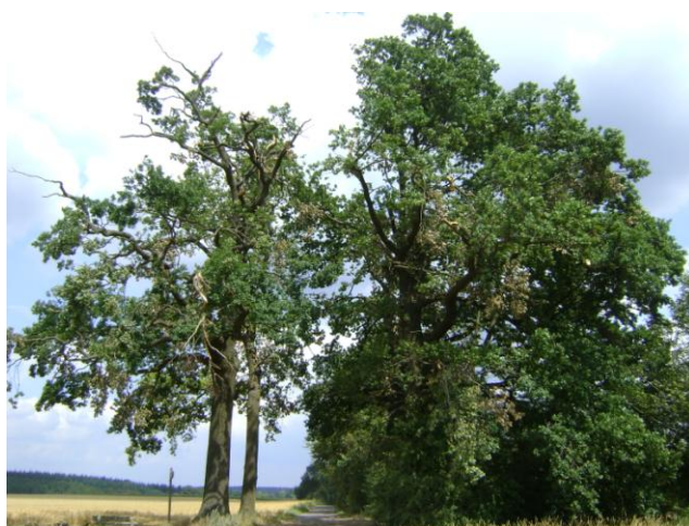
Figure 1: Photo prise avant leur élagage en 2011

Leur état sanitaire est bon, seul un a été quelque peu affaibli à la suite de la foudre qui s'est abattue sur lui. En 2011, un élagage afin de retirer les branches mortes de leur houppier a été réalisé.