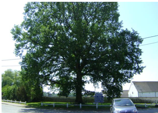
Figure 8 : Chêne pédonculé

Un chêne pédonculé ( Quercus robur ), appelé arbre du cinquantenaire, d'une hauteur de 21 m et d'une circonférence de 2,61 m est visible dans le terre-plein situé côté rue de l'Enfer.