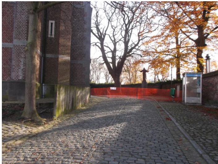
Figure 2: Marronnier d'Inde (photo prise avant son abattage)

Jusque fin 2014, on pouvait y observer un Marronnier d'Inde ( Aesculus hippocastanum ) d'une hauteur de 19 m et d'une circonférence de 2,97 m.