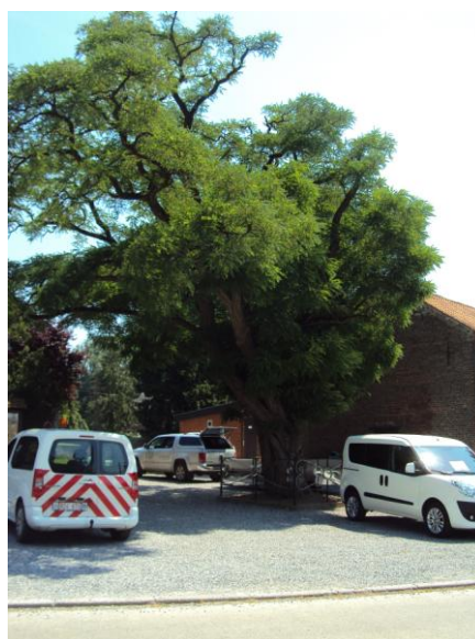
Figure 9 : Robinier faux-acacia après élagage