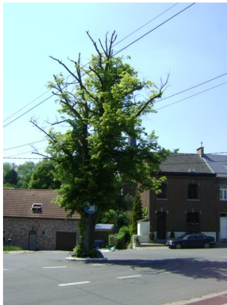
Figure 11: Tilleul à grandes feuilles avant son élagage de 2010

Un tilleul à grandes feuilles ( Tilia platyphyllos ), quelque peu dépérissant mais ne présentant pas de problème de stabilité est présent et sert d'ilot pour les véhicules au niveau des croisements de rues.