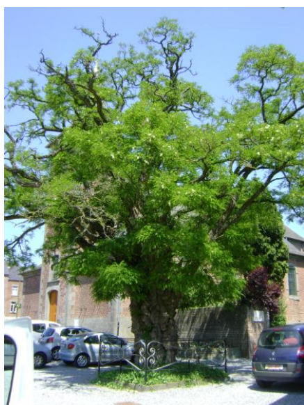
Figure 10 : Robinier faux acacia avant son élagage de 2010

Un robinier faux-acacia ( Robinia pseudoacacia ) d'une hauteur de 14 m et d'une circonférence de 3,60 m est présent sur le parking de l'église. A l'arrière, près de la cure, on aperçoit un tilleul de Hollande ( Tilia x europaea ) de 22 m et d'une circonférence de 2,60 m.