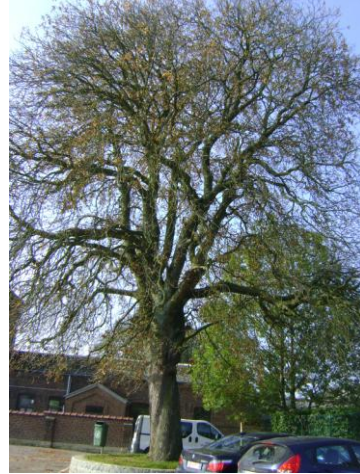
Figure 5 : Photo prise en automne 2014